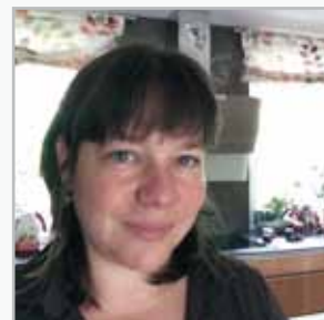
Andrea Höhne-Koehn DreaDesign Layout, Gestaltung, Satz